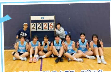
中學校際籃球比賽 女子甲一組第五名