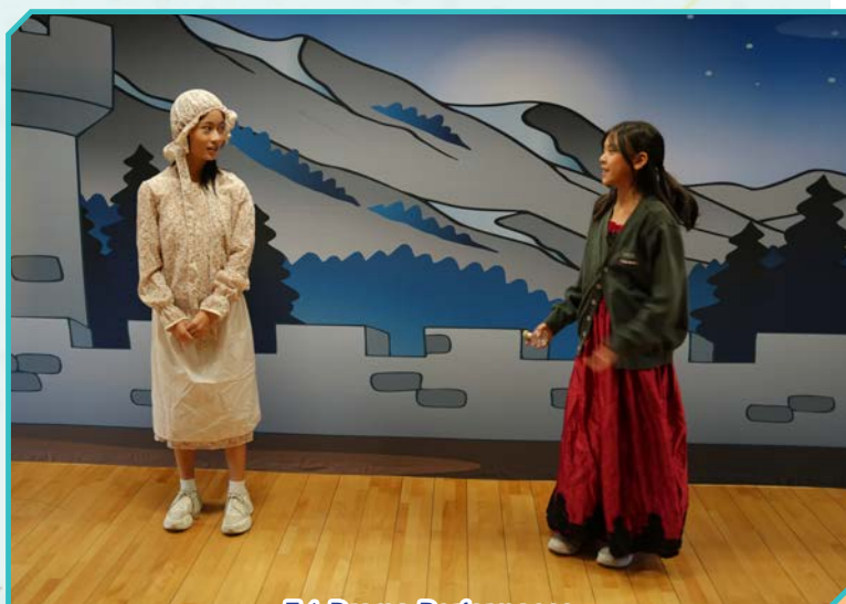
F:1 Drama Performance

Within the campus, regular lunchtime English initiatives, such as the Halloween parade, are organized, allowing students to experience the cultural elements of the language in a lively and enjoyable atmosphere. Complementing these initiatives, our Form 1 Groups 1 and 2 students took the stage in a captivating drama performance that left the audience in awe. The plays, centered around the theme of perseverance, enabled students to explore their acting talents while developing their public speaking skills.