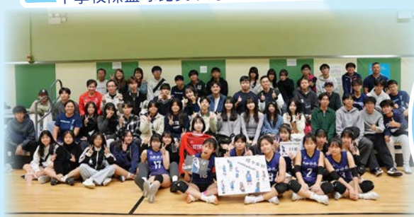
中學校際排球比賽 女子甲一組亞軍