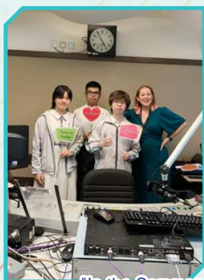
"In the Common Room" by RTHK