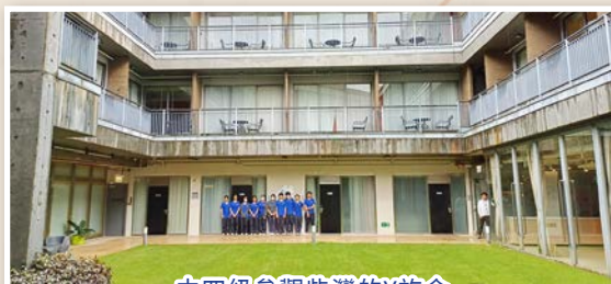
中四級參觀柴灣的Y旅舍