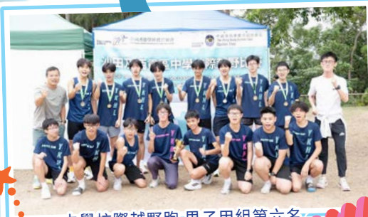
中學校際越野跑 男子甲組第六名