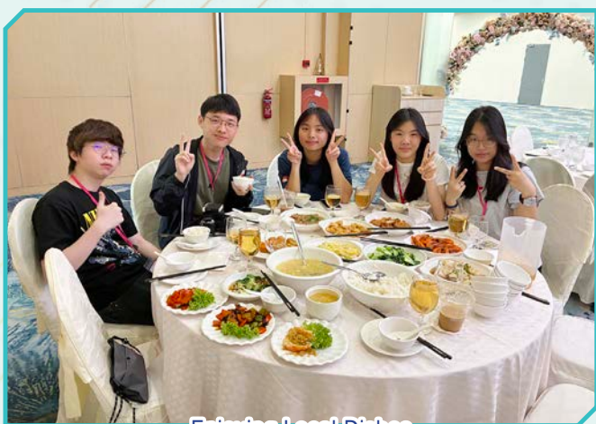
Enjoying Local Dishes