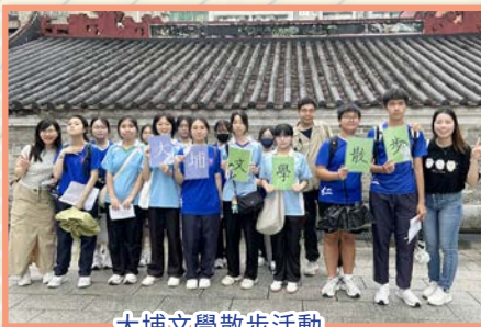
大埔文學散步活動