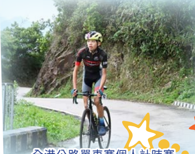
全港公路單車賽個人計時賽