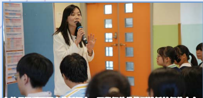
在校長溫暖而堅定的話語中，同學們彷彿找到說話前行的方向，靜靜地聽著，不願錯過每一句話。

為了讓中六同學提早適應放榜當日的節奏與情緒，我們特別舉辦了模擬放榜活動。當天，校長親臨現場，為同學們打氣加油，氣氛既緊張又溫馨。無論結果如何，這次經歷都讓大家更有準備、更加堅定地邁向人生下一站！