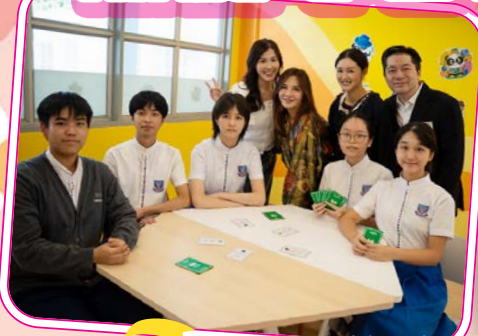
無憂心舍提供桌上遊戲讓學生鬆一鬆