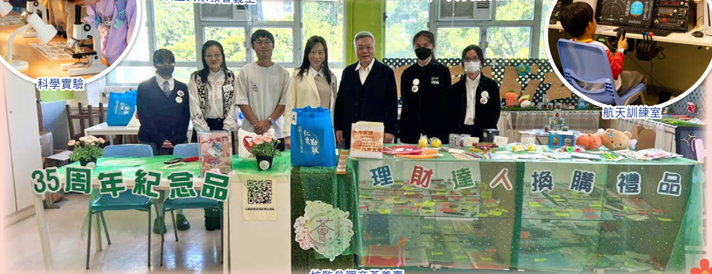
校監參觀商會義賣