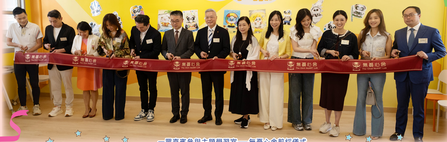
一眾嘉賓參與主題學習室——無憂心舍剪綵儀式