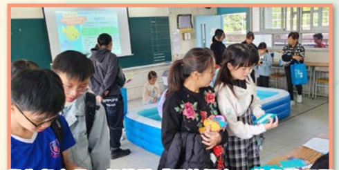
學生與家長一起挑戰「問答擂台」的趣謎巧題