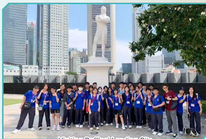
Visiting Raffles' Landing Site

The study tour was a transformative experience for all participants, blending cultural exploration with significant opportunities for English enhancement. Here is some of the feedback they provided: