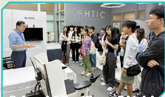
Exchange Activities at Nanyang Polytechnic

To enrich English learning and expand our students' horizons, a summer study tour to Singapore was organized last summer. During this trip, students immersed themselves in an English-speaking environment, honing their language skills while exploring the city's vibrant cultural landscape. Notably, the exchange activities at Nanyang Polytechnic enriched our students' understanding of cutting-edge fields such as Artificial Intelligence and Robotics. Furthermore, sampling the local cuisine deepened their cultural appreciation.