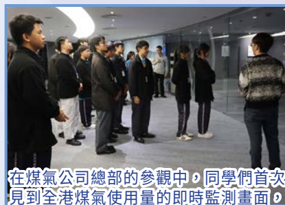
在煤氣公司總部的參觀中，同學們首次見到全港煤氣使用量的即時監測畫面，螢幕上數據不斷跳動，彷彿城市的呼吸節奏，讓人嘆為觀止。