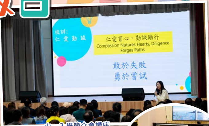
中一入學簡介會講座