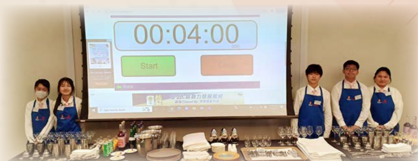
同學參加「世界技能大賽香港代表選拔賽」（餐飲服務）

適逢「楊中 35 周年校慶」，旅款科與經濟科攜手合作，在十一月「楊中資訊日」中設置一個充滿動感和吸引力的學習元素遊樂攤位，受到訪人士紛紛點讚！