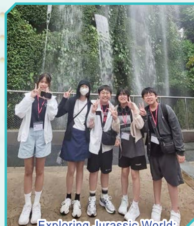
Exploring Jurassic World: The Experience at Gardens by the Bay

To enrich English learning and expand our students' horizons, a summer study tour to Singapore was organized last summer. During this trip, students immersed themselves in an English-speaking environment, honing their language skills while exploring the city's vibrant cultural landscape. Notably, the exchange activities at Nanyang Polytechnic enriched our students' understanding of cutting-edge fields such as Artificial Intelligence and Robotics. Furthermore, sampling the local cuisine deepened their cultural appreciation.