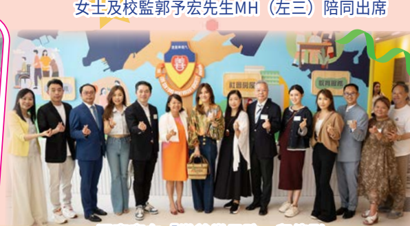
眾嘉賓在「樂善堂足跡」留倩影