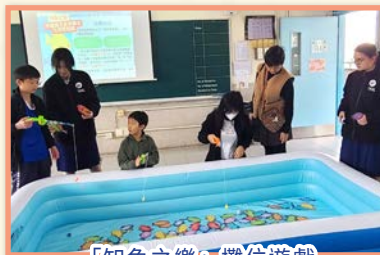
「知魚之樂」攤位遊戲

對外比賽屢創佳績，對內的啟蒙同樣不遺餘力。為迎接中一新生，我們在中一資訊日精心設計了攤位遊戲「知魚之樂」，透過有趣的釣魚遊戲，結合語文知識問答擂台，讓學弟妹在歡樂中初步領略中文的趣味與奧妙，點燃對學習語文的興趣。