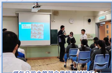
煤氣公司主管親自傳授面試技巧，讓同學們對職場準備有更深體會。

在職涯縮影活動中，同學們有幸參觀煤氣公司總部，深入了解能源行業的運作模式。從智能能源管理到可持續發展策略，大家都大開眼界。原來，一瓶煤氣背後，藏着無數工程師與專業團隊的心血！