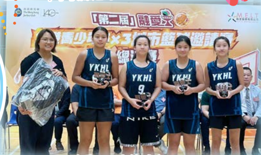
融愛盃三人籃球賽 U19 亞軍