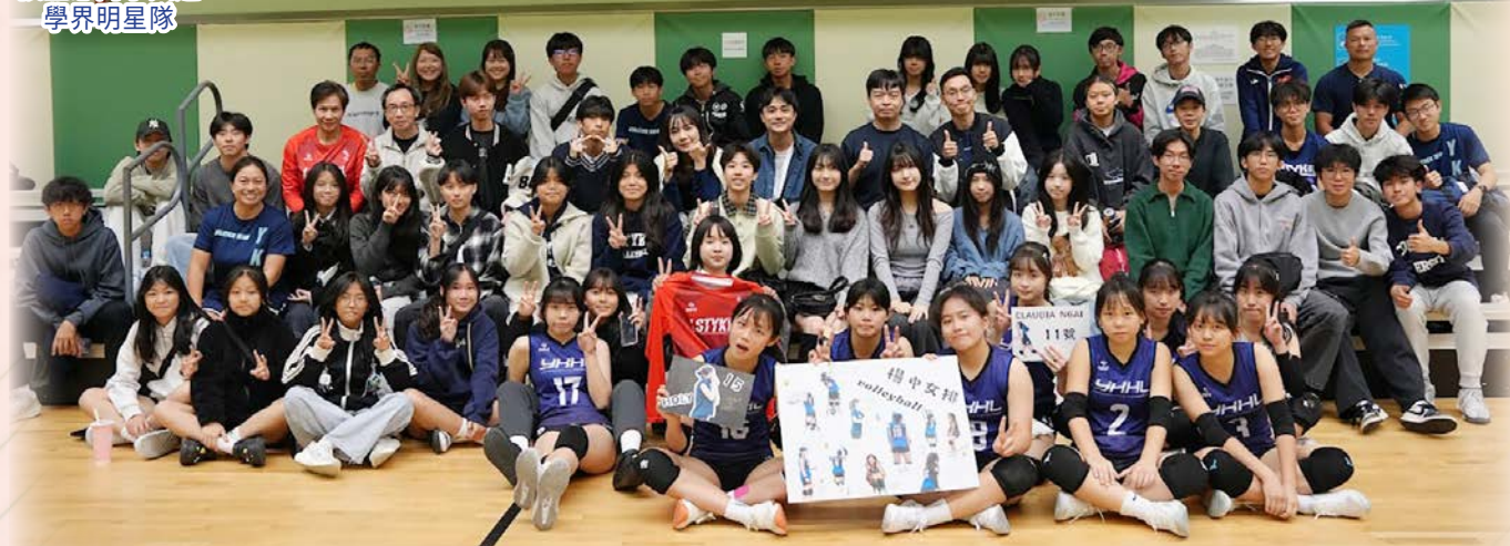
眾多師生、家長和校友到場支持