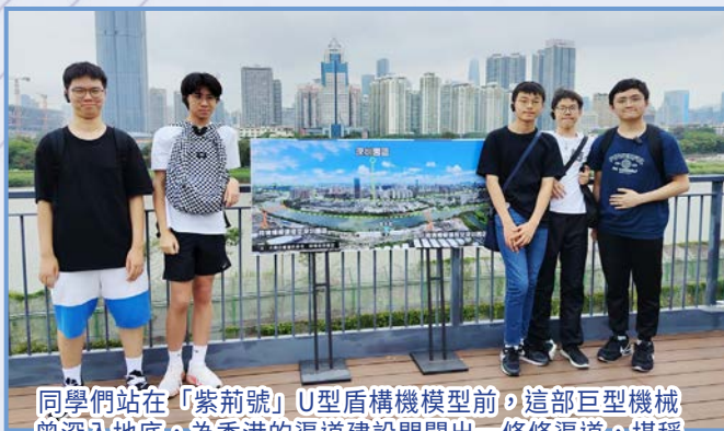
同學們站在「紫荊號」U型盾構機模型前，這部巨型機械曾深入地底，為香港的渠道建設開闢出一條條渠道，堪稱城市發展的無名英雄。

一群對建築與工程充滿熱情的同學，早前參加了土木工程遊學團，親身走訪建築工地，了解工程師的日常工作。從橋樑設計到地基建設，大家不但學到書本以外的知識，更對未來的升學及職涯方向有了更深的思考。誰知道，下一位打造地標建築的大師，會不會就在我們當中呢？