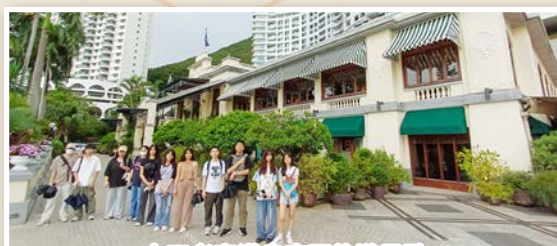
中四考察港島南區旅遊景點