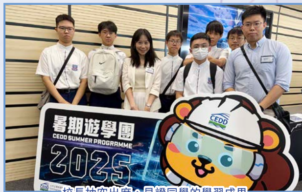
校長抽空出席，見證同學的學習成果