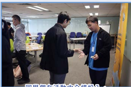
同學們在活動中全情投入，積極參與每一環節。