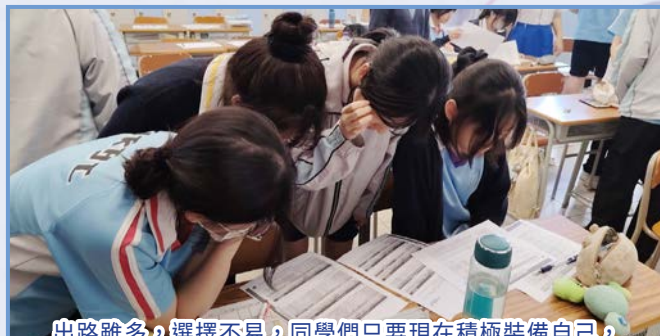
出路雖多，選擇不易，同學們只要現在積極裝備自己，相信放榜當日，都能自信地迎接人生新篇章。

生涯規劃不只是選科選校，更是認識自己、發掘潛能的旅程。願各位同學在探索的路上，越走越有方向，越走越有自信！