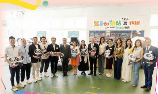
無憂加油站提供AI跑步機促進運動健康