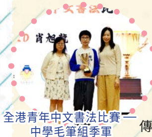
全港青年中文書法比賽——中學毛筆組季軍

中文科一向以多元活動啟迪學生，在文學創作、書法藝術與文化體驗上均提供適當的舞台，讓同學在實踐中感受中文的魅力。