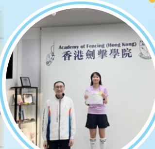
香港劍擊學院 2025 年度第四季比賽