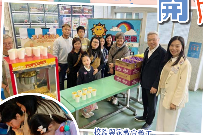
校監與家教會義工