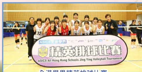
全港學界精英排球比賽