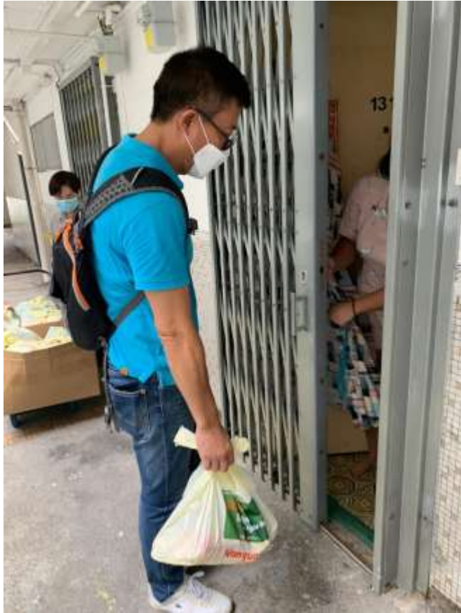
樂善堂義工上門為黃大仙區長者派發食物包

樂善堂衷心感謝各界，於非常時期時，向本堂提供幫助，包括善長無私的捐贈與及義工們熱心的支援，共同為社會有需要人士，提供適時援助，獻上溫暖。