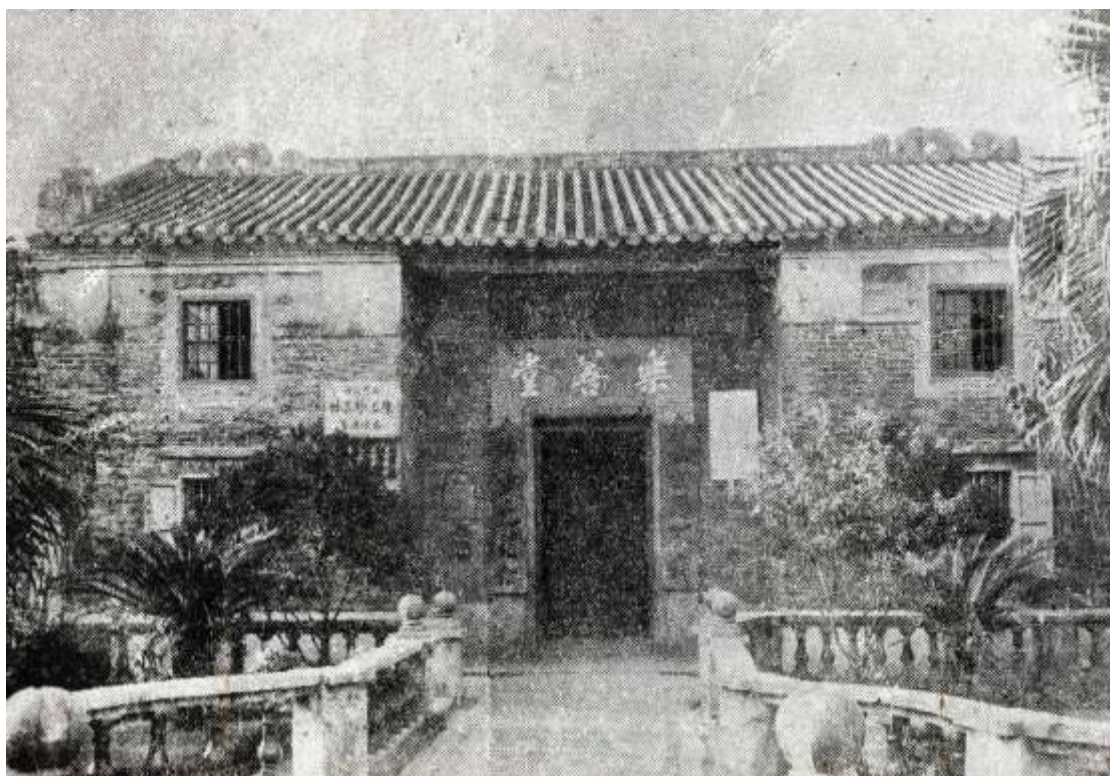
九龍樂善堂原址建於1880年