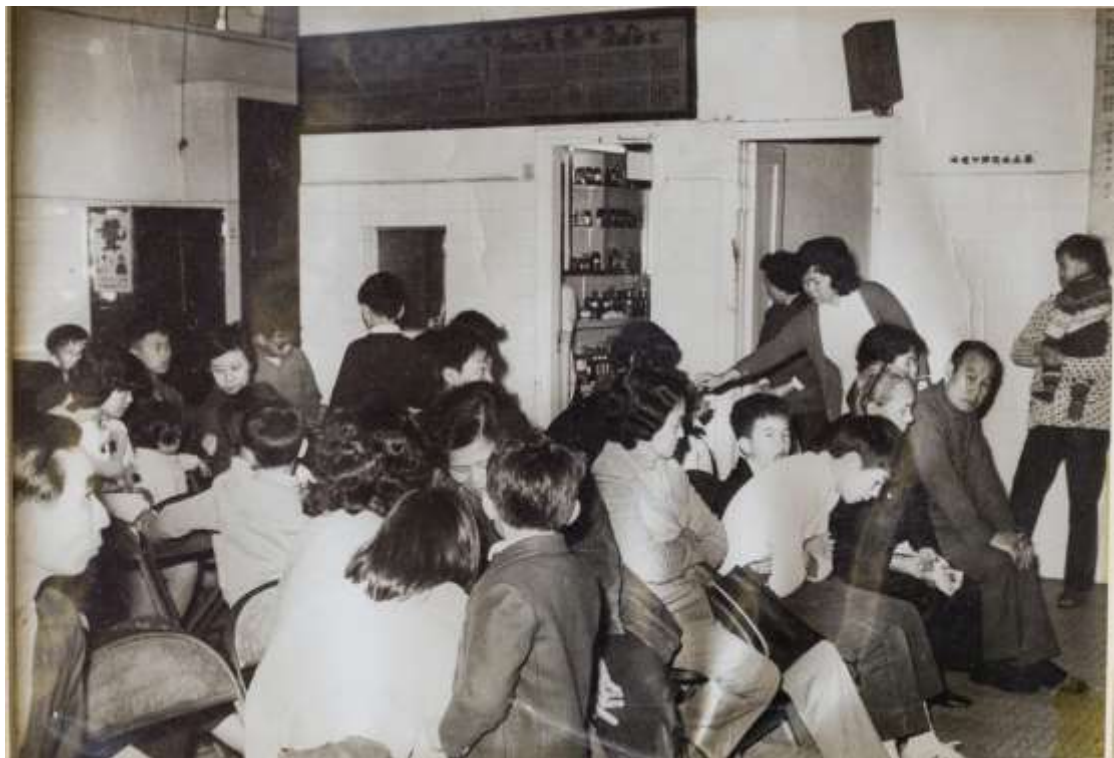
當年樂善堂醫療所候診場面