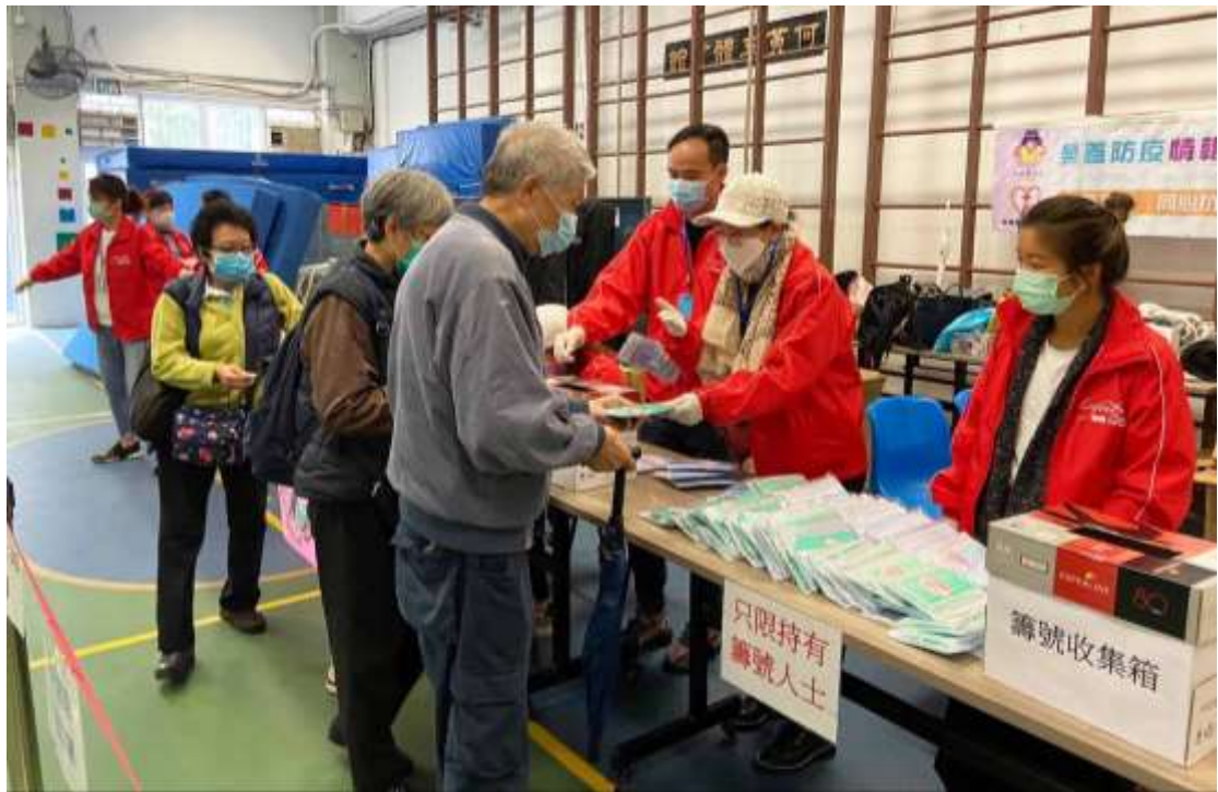
樂善堂將收到的防疫物資派發予有需要人士

而自7月份起，本港爆發第三波疫情，樂善堂有見部分居住於公共屋邨的長者，因擔心染疫而足不出戶，家裡糧食漸見緊絀。樂善堂於是於7月17日開始，受民政事務總署委託及資助下，向黃大仙區長者派發食物包，以解長者們燃眉之急。截止8月31日，已派出逾2萬5千個食物包予獨居或雙老同住長者。於8月初，亦與油尖旺民政事務處合作，為油尖旺區少數族裔送上抗疫食物包。