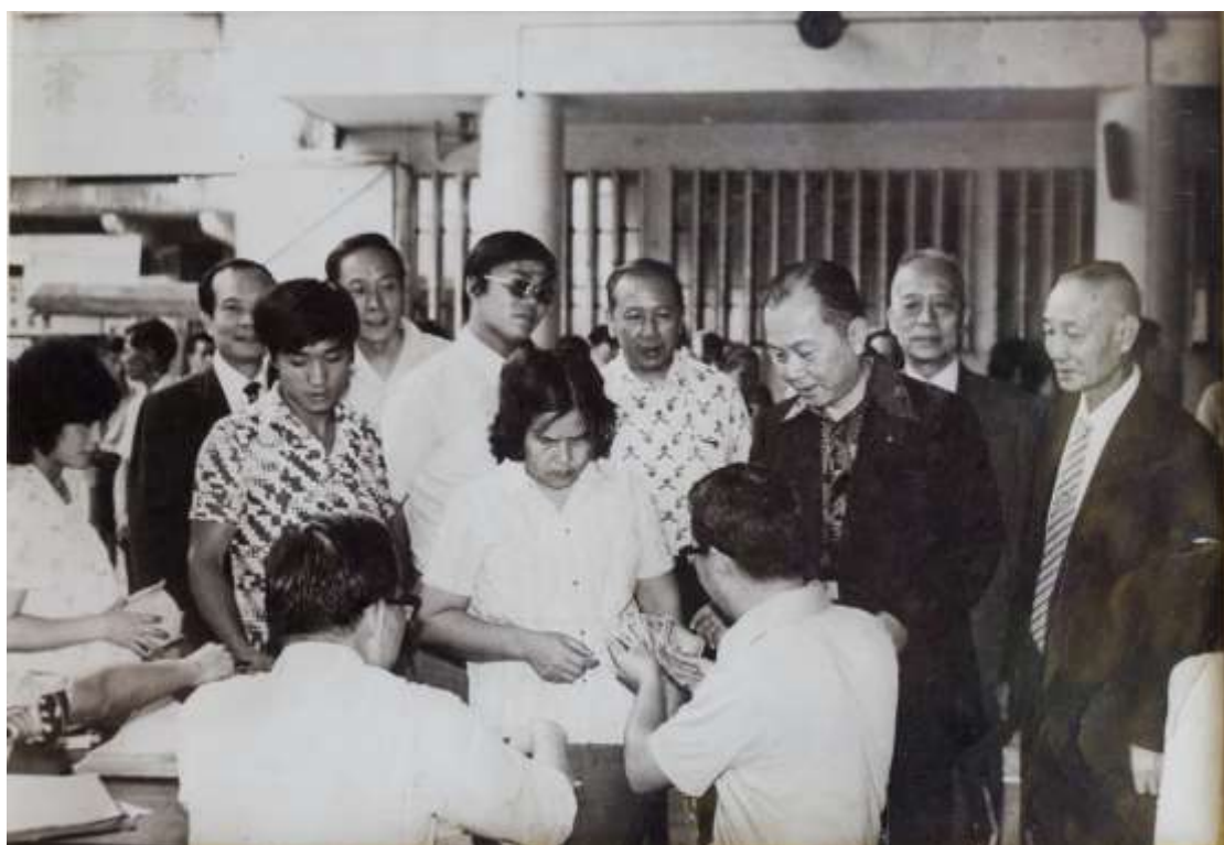
樂善堂當年派發救濟金的場面

樂善堂的服務與時並進，眼見當時絕大部分女子不能上學，於1929年，在九龍城區開辦首間女子義學，打破當時「女子無才便是德」之傳統。在六十年代，又